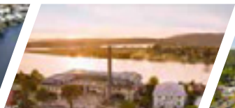
Campus Valdivia, Sede Valdivia.