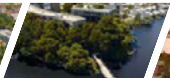
Campus Las Tres Pascualas, Sede Concepción.