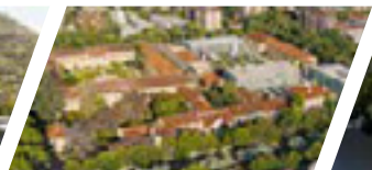
Campus Los Leones de Providencia, Sede Santiago.