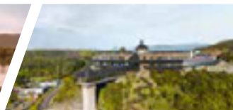
Campus Puerto Montt, Sede De la Patagonia.