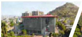
Campus Bellavista, Sede Santiago.